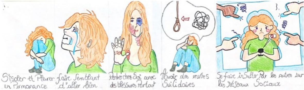
S'isoler et Pleurer faire semblant en permanence d'aller bien Rechercher des amis avec des blessures partout Honte des suicides suicidaires Se faire insulter par les autres sur les réseaux sociaux