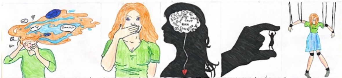
Réfléchir à ce qui attend ce nous plus tard faire le plaisir des autres en ne faisant Songer à briser de silence Devoir être inférieur à tout le monde Se faire contrôler par nos gestes et nos paroles

Alors les harceleurs, c'est pas drôle tout ça ? Bien sûr faire endurer un tel fardeau aux gens comme ça gratuitement ? Ça ne vous fait franchement pas rire ? Et pourquoi d'ailleurs ? Vous vous sentez mal à l'idée de voir cette image ci-contre et de lire ce message, et bien vous ne devriez pas !